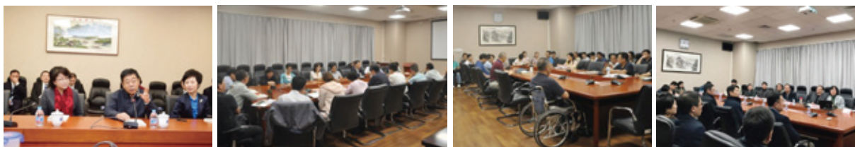
巩固“三集三提”教学组织体系

完善符合思政课教师特点的评价体系。评价体系是思政课建设的指挥棒、导向标。复旦大学积极构建思政课教师评价体系。第一，强化以政治素养提升为前提的政治导向。落实意识形态工作责任制，明确责任主体、责任清单和负面清单，巩固教职工政治理论学习常态化机制，严把思政课教师的政治关、师德关，严格执行“六年非升即走”政策，完善不合格思政课教师退出机制。第二，深